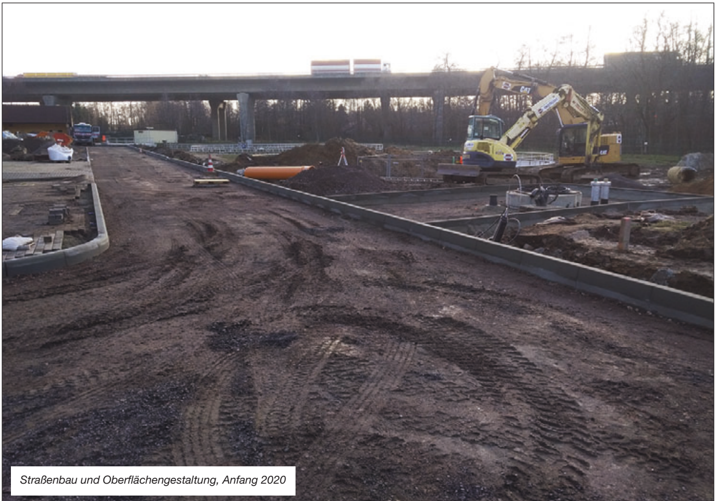
Straßenbau und Oberflächengestaltung, Anfang 2020

schinen- und elektrotechnischer Ausrüstung und in manchen Fällen einem Hochbauteil bestehen, umfasst das APW Saubachtalweg zusätzlich noch ein Abwasserhebewerk mit Schnecken- und Kreiselpumpen, einen 2-straßigen Feinrechen, einen belüfteten Sandfang, einen Sandklassierer, 2 Tagesspeicher und 3 Notfallbecken mit Rührtechnik und