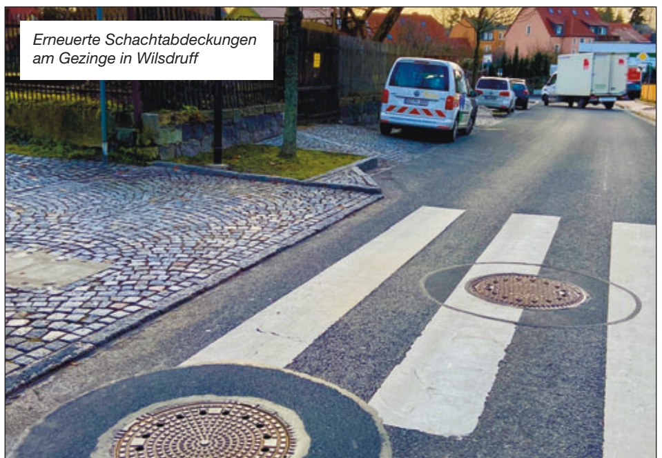
Erneuerte Schachtabdeckungen am Gezinge in Wilsdruff