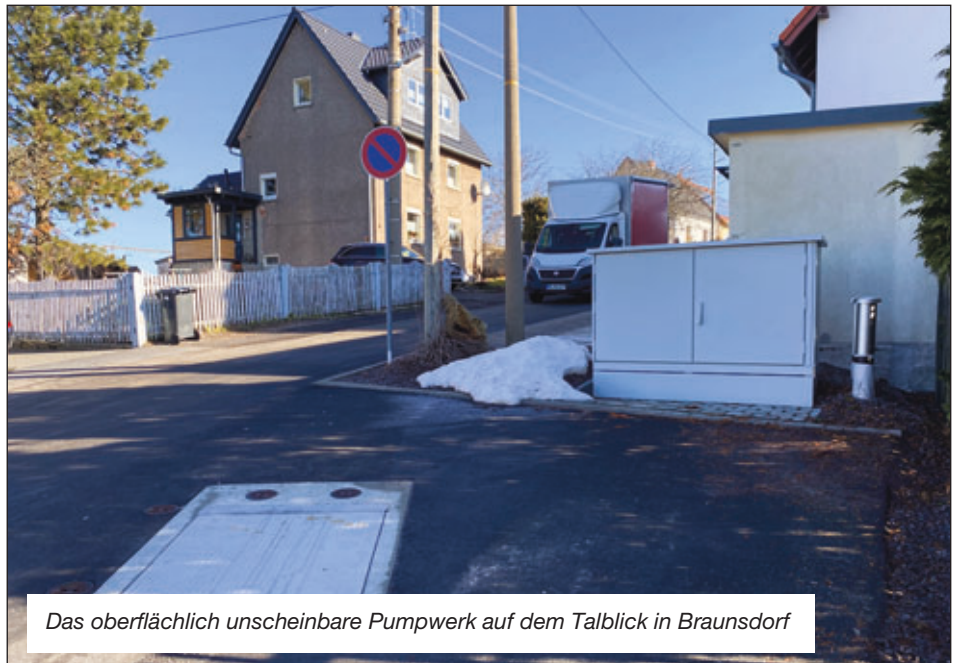
Das oberflächlich unscheinbare Pumpwerk auf dem Talblick in Braunsdorf

Die 24 Regenbecken des Verbandsgebietes wurden regelmäßigen Betriebsprüfungen nach Starkregen, mindestens aber vierteljährlichen Kontrollen, unterzogen. Zudem erfolgte die Wartung der maschinentechnischen Ausrüstung. Die Bewirtschaftung der Rasenflächen erfolgte durch die Firma Krasulsky bzw. an den RKB 15, RKB 16, RKB 17 und RKB 19 durch Beweidung. Die SEDD hat dazu vertragliche Regelungen mit zwei Schäfern abgeschlossen. Neben dem Vorzug einer ökologischeren Form der Bewirtschaftung konnte für den AZV „Wilde Sau“ auch ein Kostenvorteil in vierstelliger Höhe erzielt werden.