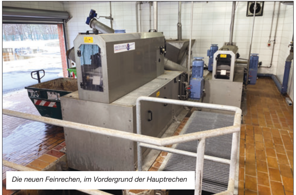
Die neuen Feinrechen, im Vordergrund der Hauptrechen

Wie bei den meisten neu errichteten Anlagen waren auch bei der nunmehr als „Abwasserpumpwerk Saubachtalweg“ (APW Saubachtalweg) bezeichneten Anlage in den ersten Betriebsmonaten diverse „Kinderkrankheiten“ zu beheben. Dazu zählten insbesondere Störungen an Überwachungssensoren der Abwasserpumpen, die immer wieder als Fehlalarme im elektronischen Leitsystem auftraten. Es hat einige Monate gedauert, bis deren Ursachen gefunden waren. Grundsätzlich kann aber resümiert werden, dass die Pumpanlage gut funktioniert und insbeson-