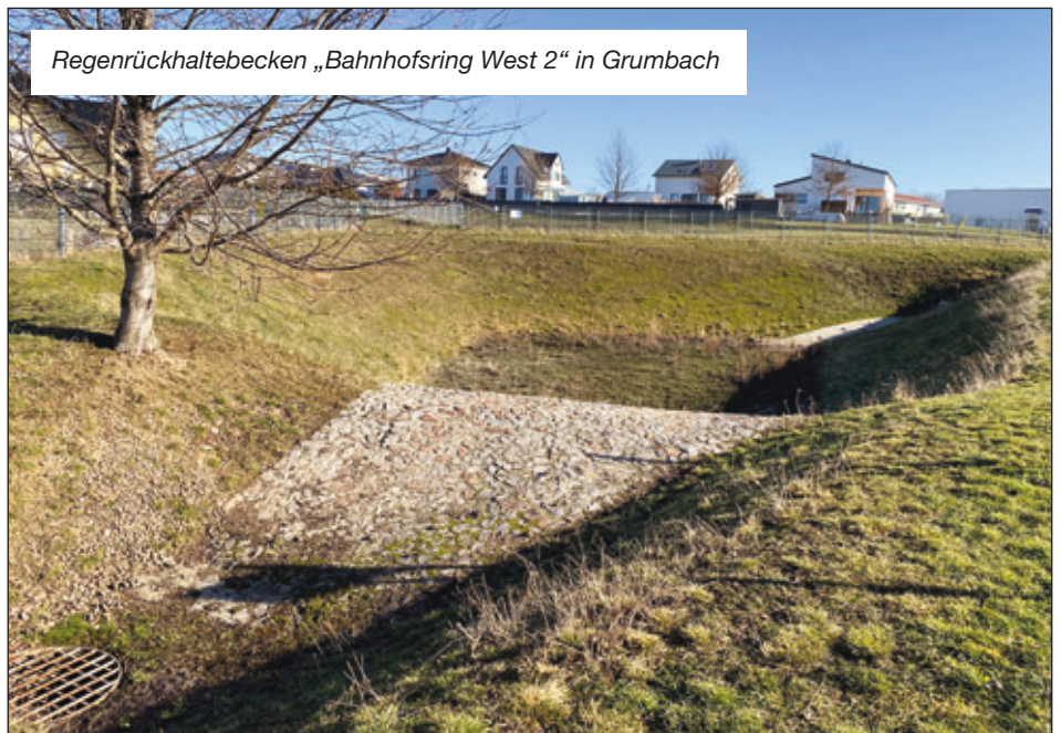
Regenrückhaltebecken „Bahnhofsring West 2“ in Grumbach