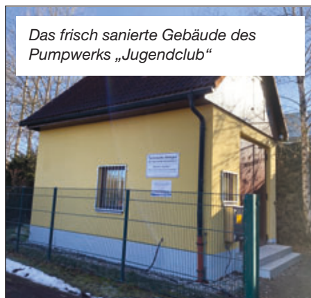
Das frisch sanierte Gebäude des Pumpwerks „Jugendclub“

mäßigen Instandhaltung wurde auch die Durchflussmessung erneuert. Der Betriebsführer hat dem AZV „Wilde Sau“ Vorschläge für den weiteren Ausbau der Abwasseranlagen in Limbach unterbreitet, die noch weiter diskutiert werden müssen.